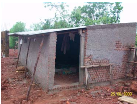
Boven: Onderkomen van de bewaker